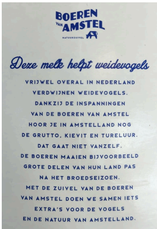
Boeren van Amstel